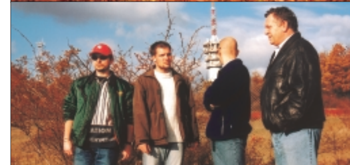
Poslední nádherný podzimní den jsme zakončili dvouhodinovou procházkou v blízkém lese. Za námi je vidět vysílač Hády, ze kterého je šířen také signál Radia Proglas pro Brno a okolí.