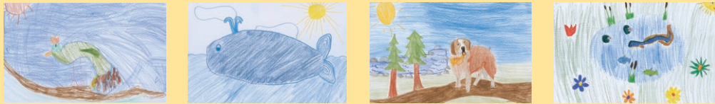
Beatka Hurychová, 4 roky: Páv; Evča Hajčiarová, 10 let: Velryba; Anička Hurychová, 6 let: Bernardýn s trumpetou; Tereza Bártová, 9 let: Rybník.

Všechny obrázky dětí jsou reakcí na dětské pořady Rádía 7.