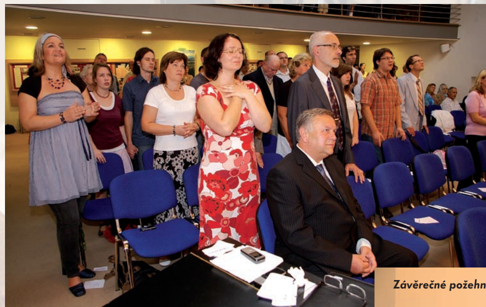
Společné, zpívané chvály.