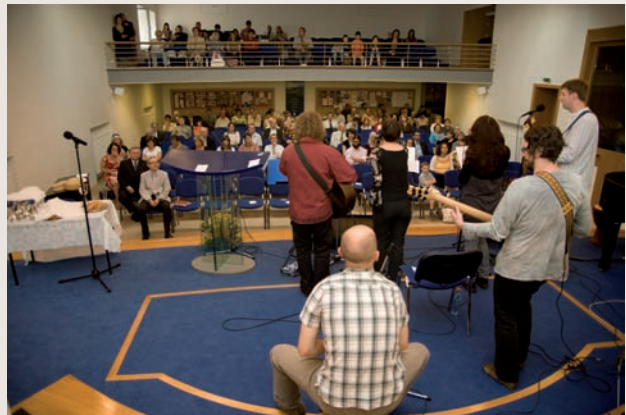
Třicet minut před oficiálním začátkem sloužila zpěvem skupina Terebint. Kapela pojala malý koncert jako velkou gratulaci a mnozí z pracovníků byli příjemně dojeti. Děkujeme!