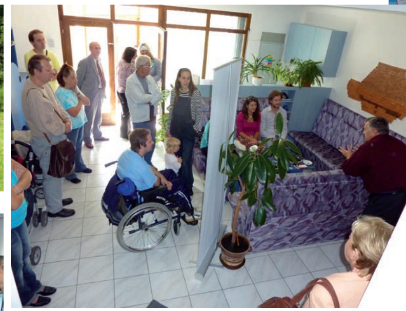
V přijímací hale naší budovy vyslechly jednotlivé skupiny základní informace o práci TWR-CZ a pak se vydaly na prohlídku budovy.