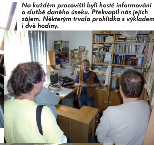
Na každém pracovišti byli hosté informováni o službě daného úseku. Prekvapil nás jejich zájem. Některým trvala prohlídka s výkladem i dvě hodiny.