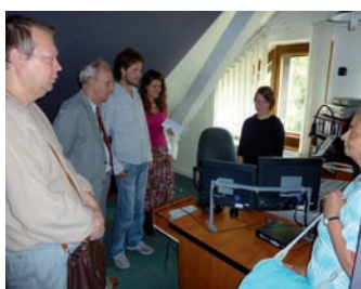
Přijeli hosté zdaleka i blízka, autem i vlakem, pěšky i na vozičku. Ze Slovenska i z Čech a všichni s úsměvem.