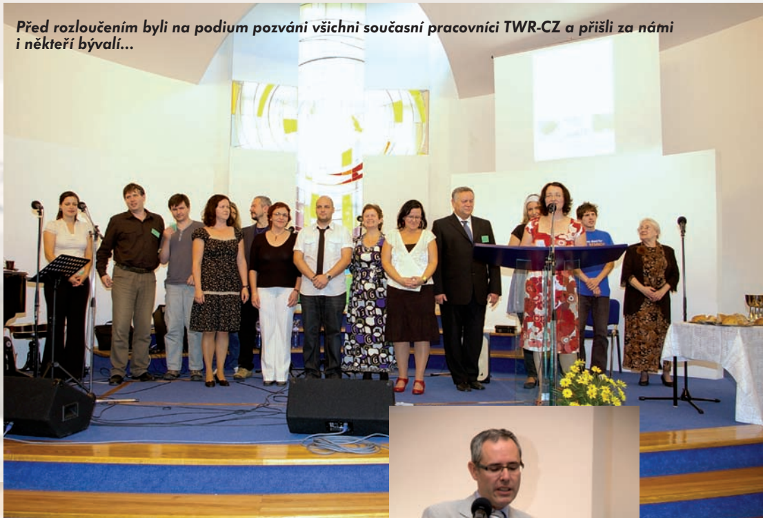
Před rozloučením byli na podium pozváni všichni současní pracovníci TWR-CZ a přišli za námi i někteří bývalí...