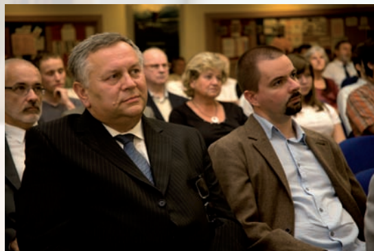
Místo slov o službě TWR-CZ hovořil nový krátký film. Všichni pozorně sledovali.