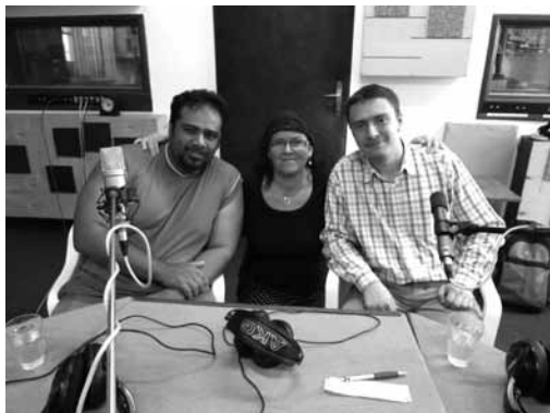
Členové kapely G. O. D. při natáčení rozhovoru pro hudební pořad Pohovka .

A za druhé Ježíš připravuje učedníky na dobu, kdy mezi nimi nebude přítomen v těle . Jako výjimečný učitel je nechává projit vlastní zkušenosti . Nějaký čas se svými učedníky prožil v úzkém vztahu, vysvětlil a předvedl jim podstatu Božího království a vztahů, které v něm panují. Pomocí jednoduchých podobností jim předal zapamatovatelné základní body učení a teď přesouvá svou pravomoc na následovníky. Uvolňuje je k tomu, aby mohli sami žít a naplňovat, co se za tu dobu naučili . Co mě na jeho postupu doslova fascinuje, je skutečnost, že jednak poslal kruh svých nejbližších, ale