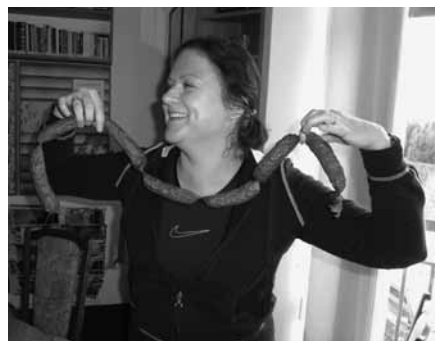
.... to bylo radosti!

mě opět přimělo k pohledu na to, co mám. Rodina, žena, děti, sbor, práce, zdraví, mír, život věčný. Pavel, Vsetín ☒ Dobrý den, před chvílí skončil pořad Modlitby podle Bible . Přiznám se, že kvůli času vysílání jsem tento pořad ještě neměla možnost slyšet celý. Od změn ve vysílání poslouchám vždy kousek středeční reprízy od 19.30 a zdá se mi, že kdyby byl tento pořad ve zvukovém archivu, stál by za poslech. Na konci pořadu jeho autorka vyzvala posluchače k napsání reakce na pořad. Proto si dovoluji zareagovat na další dvě její výzvy – abychom se modlili alespoň 5 minut denně (nebo o 5 minut déle, než se modlíme dosud) a abychom se za modlitbu odměnili čokoládou. Bude to opravdová modlitba, pokud budu přemýšlet o tom, jak dlouho se modlím? A pokud se budu něčím odměňovat? Apoštol Pavel v 1. Tesalonickým píše: „Neustále se modlete“ – v tom případě by člověk, který život s Bohem myslí vážně, umřel na předávkování čokoládou ☺. Vaše věrná, i když občas kritická posluchačka Maryla ☒ Vďaka za tému! Myslím, že našou úlohou je žít v pravdě i k sebe sa-