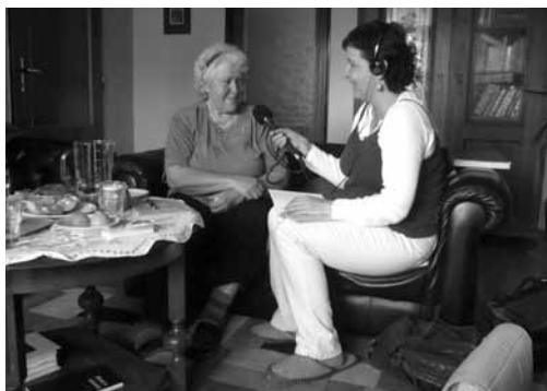
Prezentace můžeme spojit i s natáčením svědectví ☺.