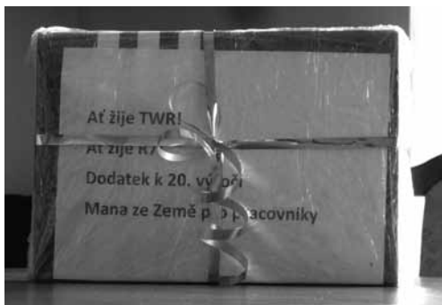
Dostali jsme krabičku od Petra Stoye...

Elektronické potvrzení můžete obdržet ihned po zapsání daru do naší evidence – stačí, když jednou zašlete ze své e-mailové adresy požadavek na tuto službu. Systém je automatizován.