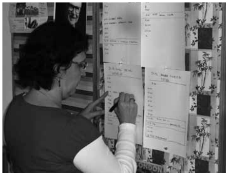
Takto vypadají začátky speciálního programového schématu – v tomto případě vánočního.

Pořízení: Satelitní soupravu lze koupit od cca 1700,- Kč. Pro poslech Rádía 7 postačí i ty nejlevnější modely. Pokud nemáte televizor, aktivní reproduktory lze pořídit od cca 150,- Kč. Provoz nestojí nic.