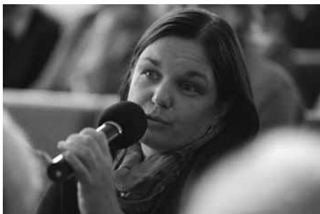
Foto z prezentace v CB v Náchodě.

Nic netušícím sedícím přistál v ruce mikrofon a jejich úkolem bylo bezprostředně pozvat k poslechu „příštího programu“ – jako v rádiu.