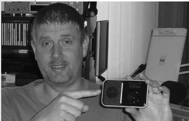
Zajímavý přijímač internetových rádií – přenosný, s vestavěnou dobíjecí baterií, přijímá bezdrátově, včetně příjmu VKV stanic.