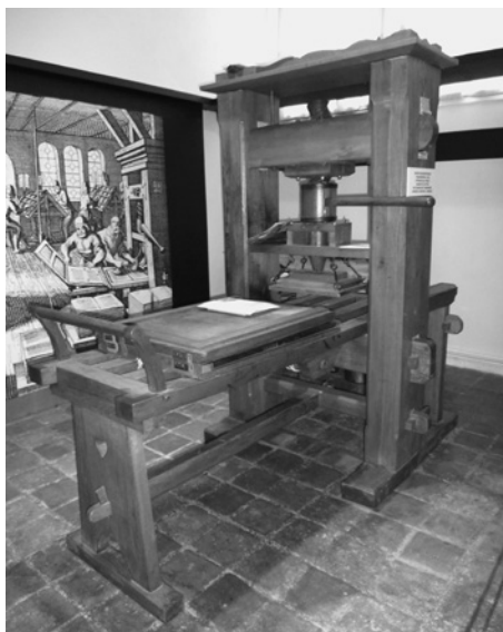
Funkční replika tiskařského lisu, na kterém nám byl předveden tisk jednoho listu z knihy proroka Izaiáše.