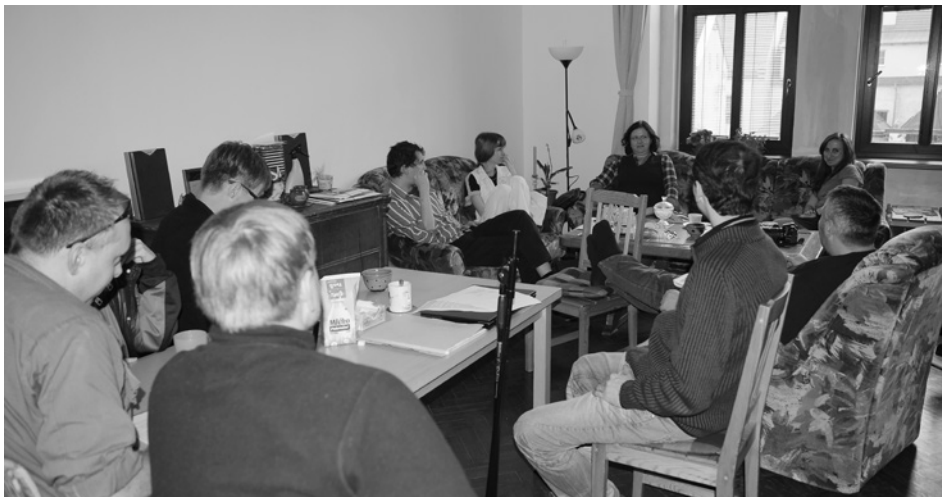
Natáčení svědectví v Chomutově – občerstvení u kávy.