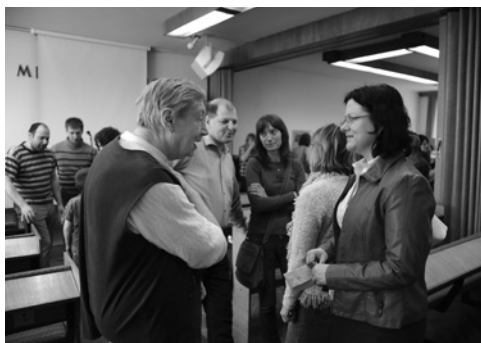
Neformální beseda po prezentaci v CB Horní Krupá. Zájem o službu i spolupráci s TWR-CZ byl velký.

i když mrzne a chumelí... A k tomu ještě vycestovat. Máme většinou rodiny, vlastní sbory a také potřebujeme trošku času na odpočinek. Ale touha vidět posluchače a udělat něco pro zviditelnění rozhlasové misie mezi věřícími byla větší a dopadlo to tak, že namísto plánovaných cca 5 prezentací jich bylo více než trojnásobek.