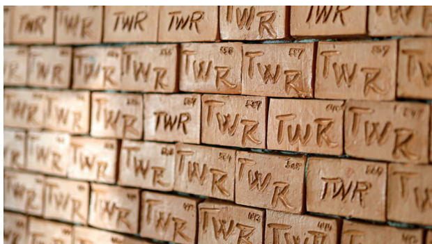
▲ Keramické cihličky na stěně vstupní haly nám stále připomínají, kolik štědrých dárců podpořilo stavbu budovy, kde sídlíme.