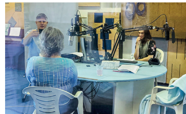
▲ Když se točí video, je třeba chodit po špičkách a fotit jen přes sklo z režie vedle studia.