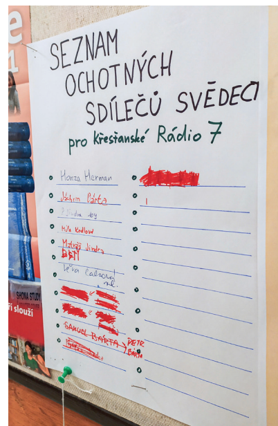
▲ Prezentace v Horní Krupě přinesla mnoho dobrého do našeho archivu – děkujeme všem, kdo byli ochotní nahrát svědectví o svém setkání s Kristem.