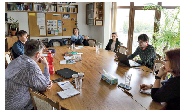
▲ Porada Misijního vedení, které řídí práci rádia.