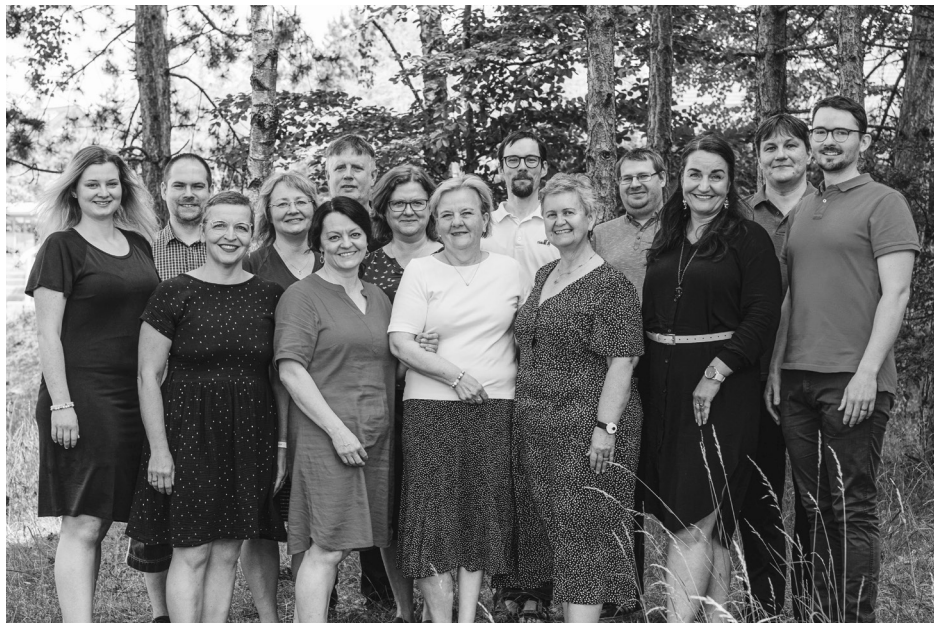
▲ Tým Rádia 7, verze léto 2023.